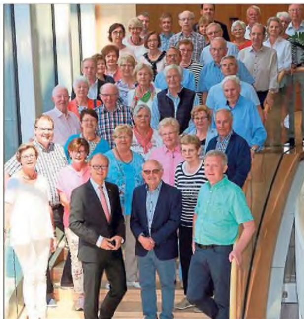
Dem heimischen Landtagsabgeordneten und Landtagspräsidenten André Kuper (vorn, Mitte) stattete die Verler CDU einen Besuch ab.