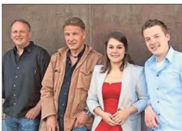
Quirliges Quartett: Die Unplugged-Band „Be Jones“ serviert Pop- und Rockklassiker.