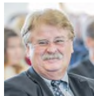
CDU Europaabgeordneter Bielefeld