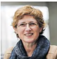
Grüne Bundestagsabgeordnete Bielefeld