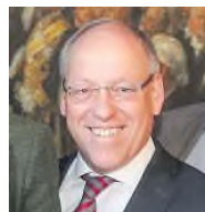
SPD Bielefelds Oberbürgermeister Bielefeld