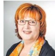
SPD Bundestagsabgeordnete Marienmünster