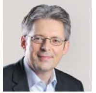
SPD Bundestagsabgeordneter Minden