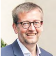
SPD Bundestagsabgeordneter Paderborn