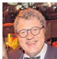
SPD Geschäftsführer Miele & Cie KG Gütersloh