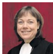
SPD Westfälische Präses Bielefeld