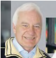
CDU Bundestagsabgeordneter Kalletal