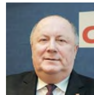
CDU Bundestagsabgeordneter Schieder-Schwalenberg