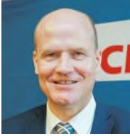
CDU Bundestagsabgeordneter Gütersloh