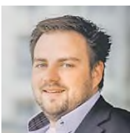
SPD Vorsitzender NRW Jusos Bielefeld