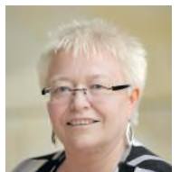
Grüne NRW-Landtagsabgeordnete Paderborn