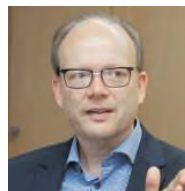
CDU NRW-Landtagsabgeordneter Rietberg