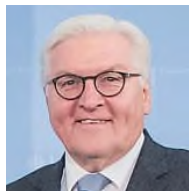
SPD Bundestagsabgeordneter Schieder-Schwalenberg