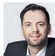
FDP NRW-Landtagsabgeordneter Paderborn