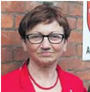
Linke Bundestagsabgeordnete Herford