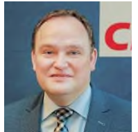
CDU Bundestagsabgeordneter Löhne

Von Finia Packmohr, Matthias Bungeoth und Martin Fröhlich