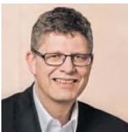
CDU Bundestagsabgeordneter Höxter