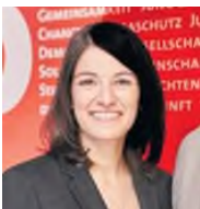
SPD Vize-Parteivorsitzende Gütersloh