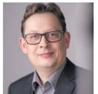
SPD Bundestagsabgeordneter Herford