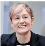
SPD NRW-Familienministerin Bielefeld