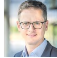
CDU Bundestagsabgeordneter Paderborn