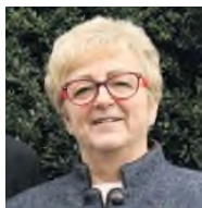
SPD NRW-Landtagsabgeordnete Minden