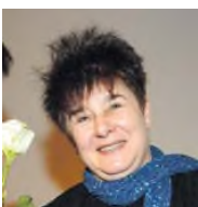
Piratenpartei Datenschützerin Bielefeld