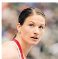
SPD Speerwurf-Europameisterin Blomberg